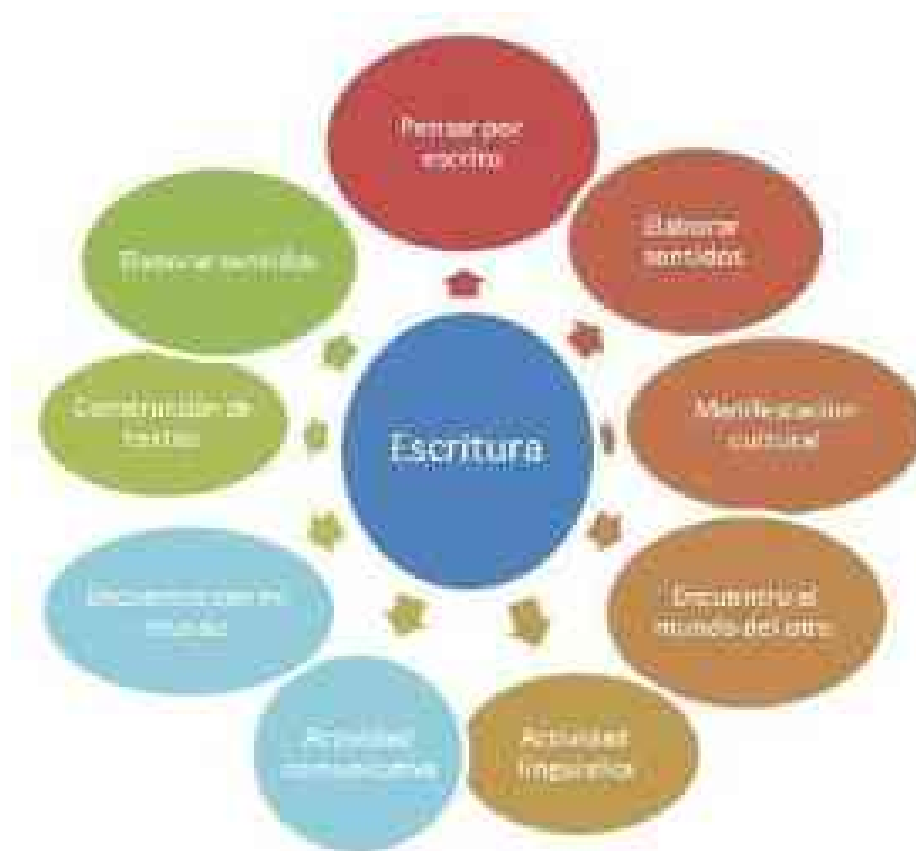
Gráfico N° 1: Procesos de expresión y producción escrita